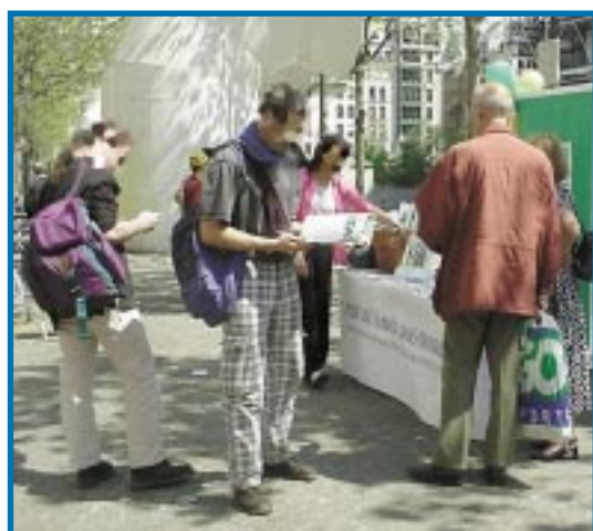
Stands de prévention à Paris.

Près de 2 millions de livrets et de prospectus ont déjà été distribués dans le cadre des campagnes de prévention anti-drogue.